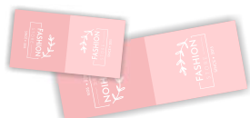
M01: 6X4CM / 9X3CM

¿Cómo se ve el formato del sticker en cada medida?