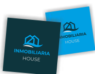
M02: 4X4CM / 5X5CM / 6X6CM